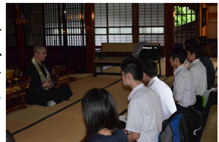
4/12 遍昭寺にて座禅体験

そして 、事前学習の中身が今回の旅行に生きていたこと。訪問先や見学地の事前学習を生かして、メモをとったり、質