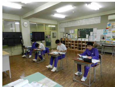
中間テストの様子

先週10月3日（水）に東北地区私立高校入試説明会が、5日（金）に県立高校入試説明会がそれぞれ開催されました。いよいよ入試の骨組みが決まり、来年度の入学者選抜に向けて動き始めました。（県立高校の現行入試制度は今年度が最後となり、来年度、つまり現在の中学2年生からは新しい入試制度での受験になります。新入試制度につきましては、別の機会にご説明いたします。）