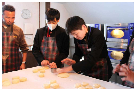
最後のレッスン、スコーン作り

いただいた他中学校生徒の皆さん、ともに学んだグループの皆さん、そして、この交流活動にご尽力いただいたすべての皆さんに感謝申し上げます。