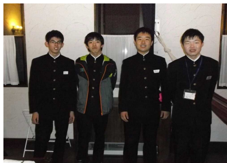
同部屋でお世話になった生徒さんです

また、レッスンばかりでなくあいさつや食事の指示、両替の依頼や買い物まで、すべて英語で対応しなければなりません。最初は戸惑っている様子でしたが、2日間英語ばかりを聞いていたせいか、理解できるようになっていたのには驚きました。外国の方が職員・講師として多く勤務されていますので、まさに本物の英語に触れた貴重な経験でした。