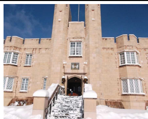
ブリティッシュヒルズにて